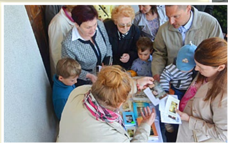
Niedziela Maryjna w Pogórze