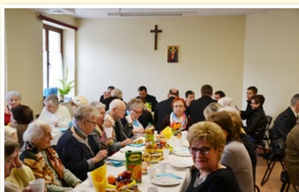
20-lecie AMM w Łodzi