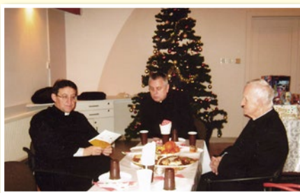
Spotkanie w Płońsku