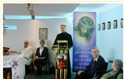
Łódź – Rekolekcje w Domu Pomocy Społecznej