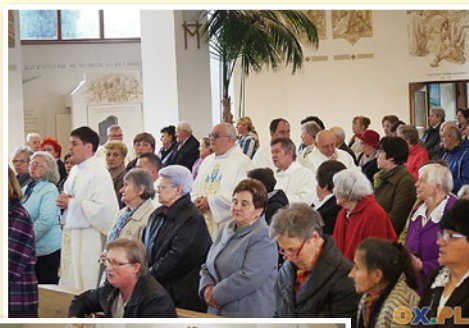
Regionalny Dzień Skupienia AMM