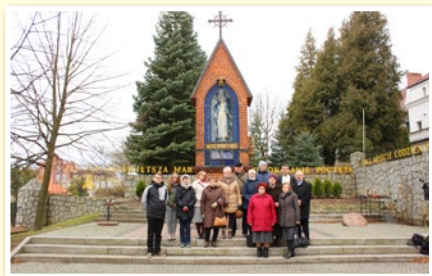
Wizyta AMM z Piotrkowa Kujawskiego w Gietrzwałdzie

24 września 2017 r., godz. 13.00 – Msza Święta Jubileuszowa